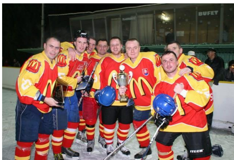
Vítaz: McDONALD ´ s team Slovakia

LIGA PROTI RAKOVINE dňa 17. apríla 2009 už trinásty rok organizovala celoslovenskú akciu zameranú na boj proti rakovine „ Deň narcisov. “ Aktivisti FONDU DOROTY KANTHOVEJ sa tiež zapojili do zbierky. V Komárne a v okolitých mestách a dedinách na mnohých miestach sme sa stretli so študentmi a inými dobrovoľníkmi Ligy proti rakovine, ktorí rozdávali narcisy. Nimi vyzbierané finančné príspevky poukázali na účet Ligy proti rakovine, ktorá ich použije na zlepšenie životných podmienok občanov postihnutých